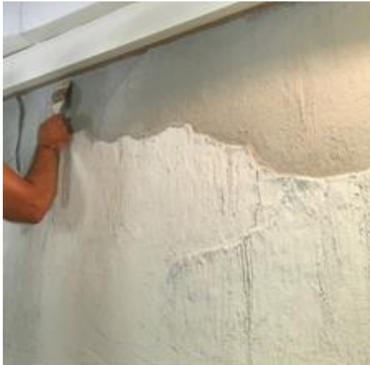
Putzauftrag und Formgabe

Einen für den Einsatzzweck geeigneten Putz mit Kelle und Traufel in unterschiedlicher Schichtdicke über die zurechtgeformte Schablone auftragen und nach Belieben nach unten hinweg flacher abtragen. Dabei soll im oberen Bereich mehr Materialdicke stehen bleiben. Der Effekt, eine Art Bruchkante, entsteht nach Abnehmen der Form. Den Putzauftrag schuppenartig nach Belieben über die zu gestaltende Fläche weiterführen.