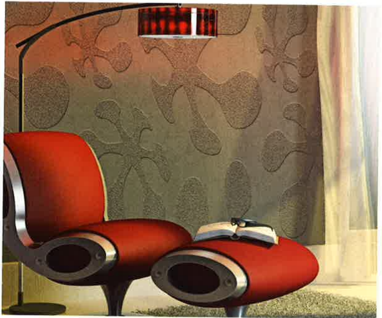
Kalkputze werden nicht nur heutigen Einrichtungsstilen gerecht, sondern schlucken auch Schadstoffe wie Schwefeldioxid und CO 2 .

Wer den reduziert-sachlichen Wohnstil präferiert, kann mit Kalkputz eine moderne Betoninterpretation erzielen.