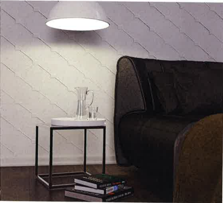
Mit handwerklichem Knowhow lassen sich die Oberflächen von raumklimaverbessernden Kalkputzen kreativ gestalten.