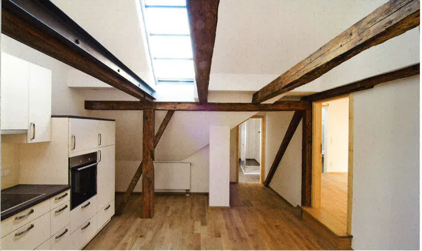
KalkGlätten und Spachtel ermöglichen im historischen und im modernen Kontext zeitgemäß glatte Oberflächen.